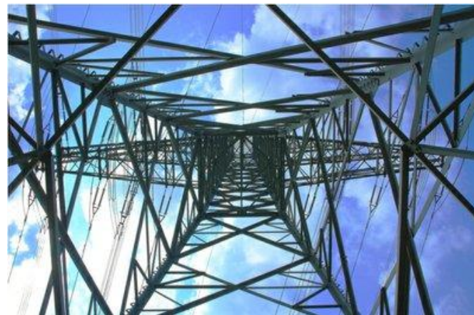
Оборудование для энергетики и энергосбережения